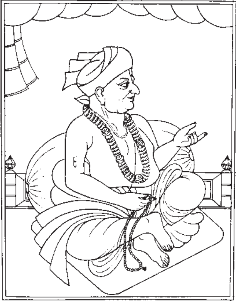
अक्षरब्रह्म सद्गुरु गुष्पातीतानंद स्वामी