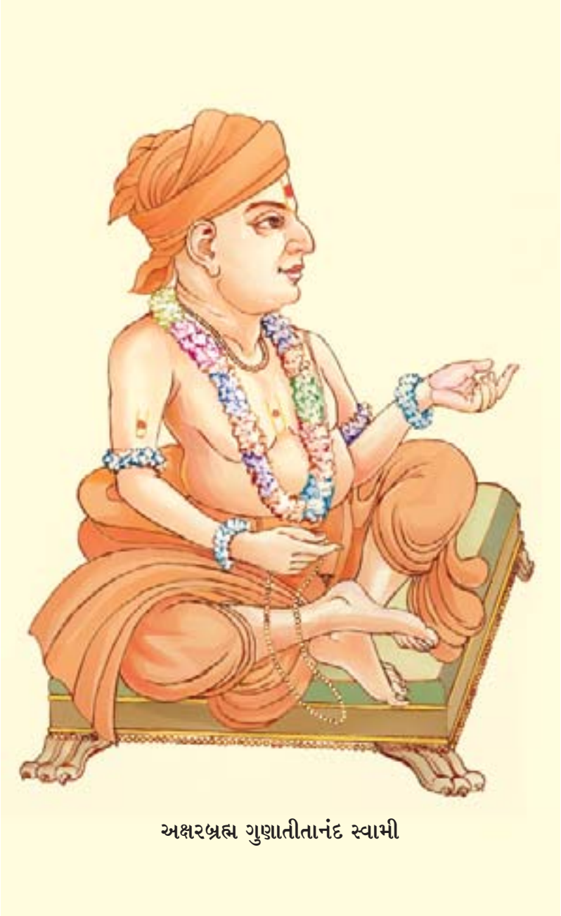
અક્ષરબ્રહ્મ ગુણાતીતાનંદ સ્વામી