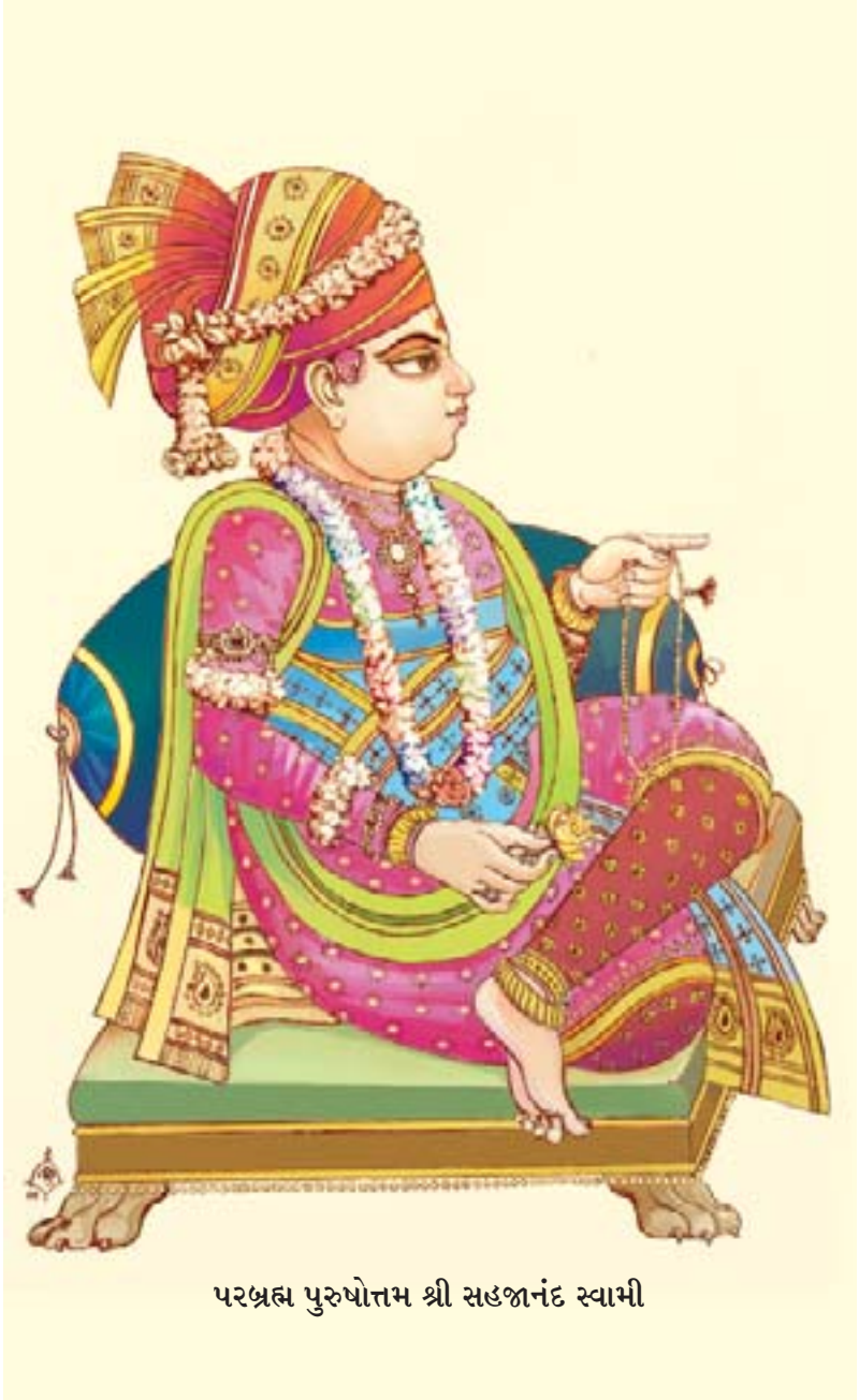
परब्रह्म पुरुषोत्तम श्री सडजनंद स्वामी