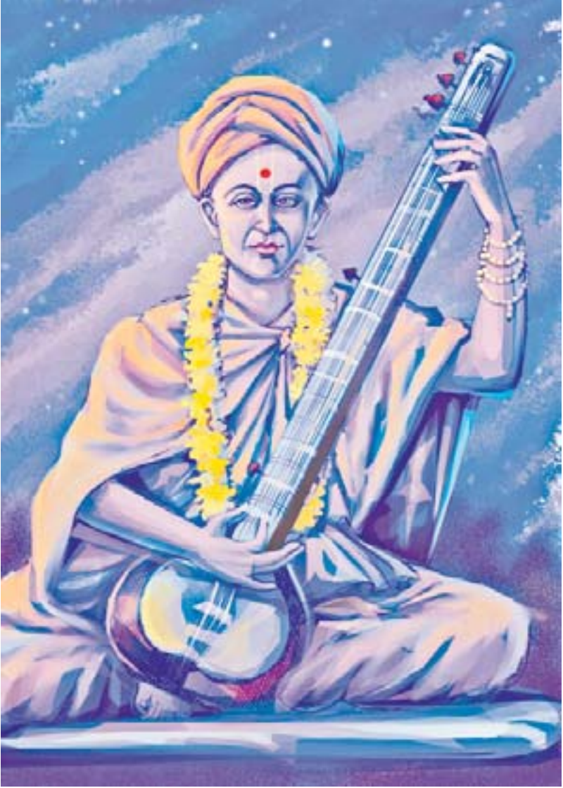
સદ્ગુરુ દેવાનંદ સ્વામી