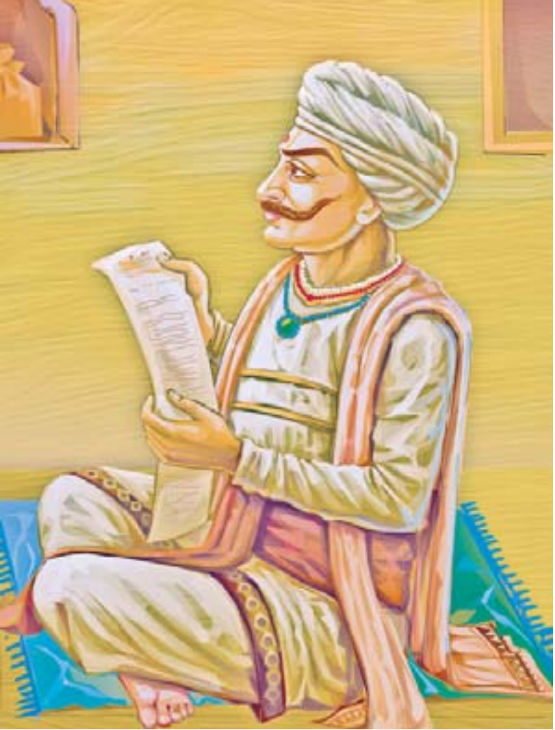
ભક્તરાજ દરબાર શ્રી ઝીણાભાઈ