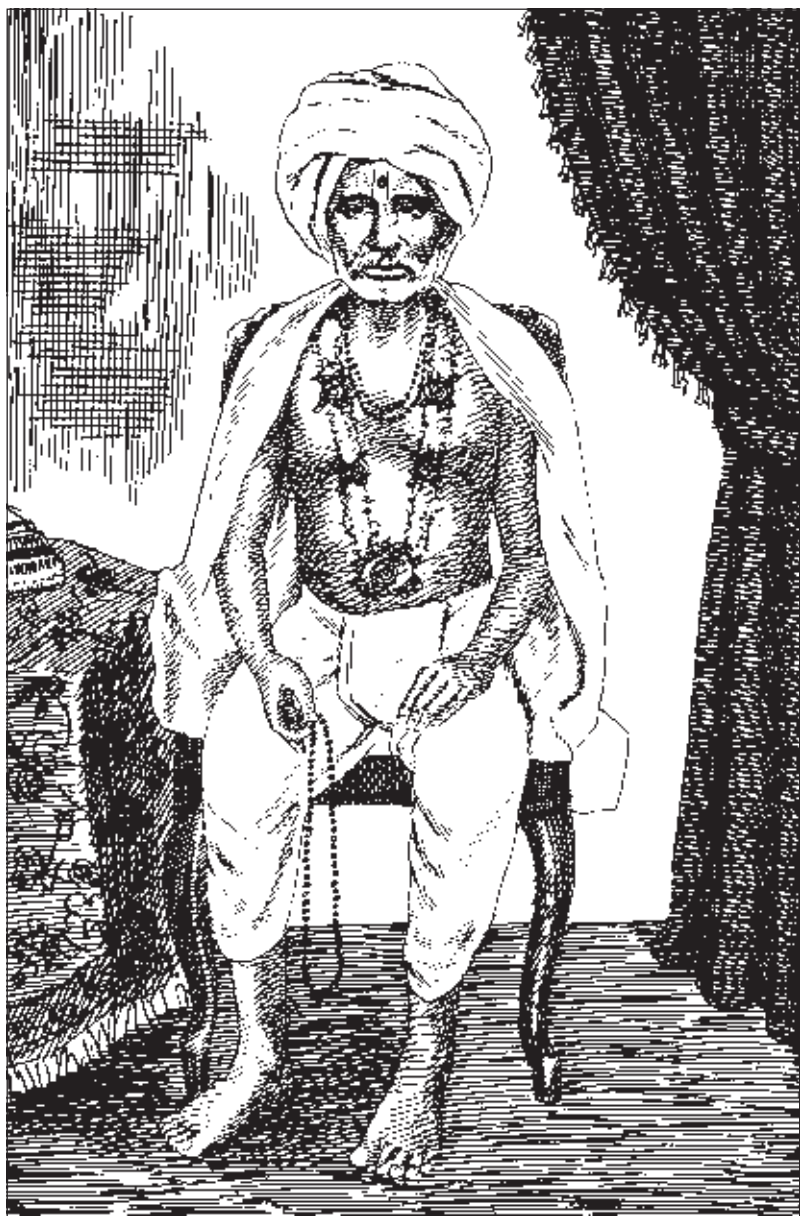
સ્વામી જાગા ભક્ત