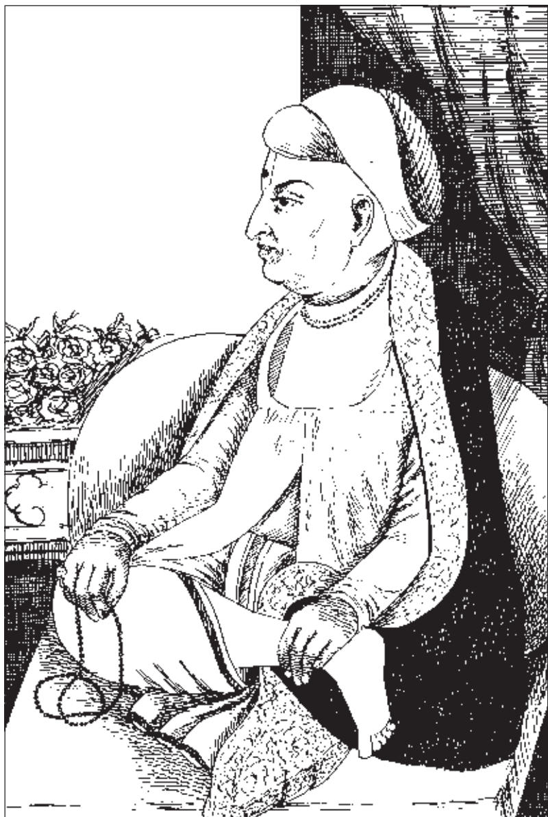
આચાર્યશ્રી અયોધ્યાપ્રસાદજી મહારાજ