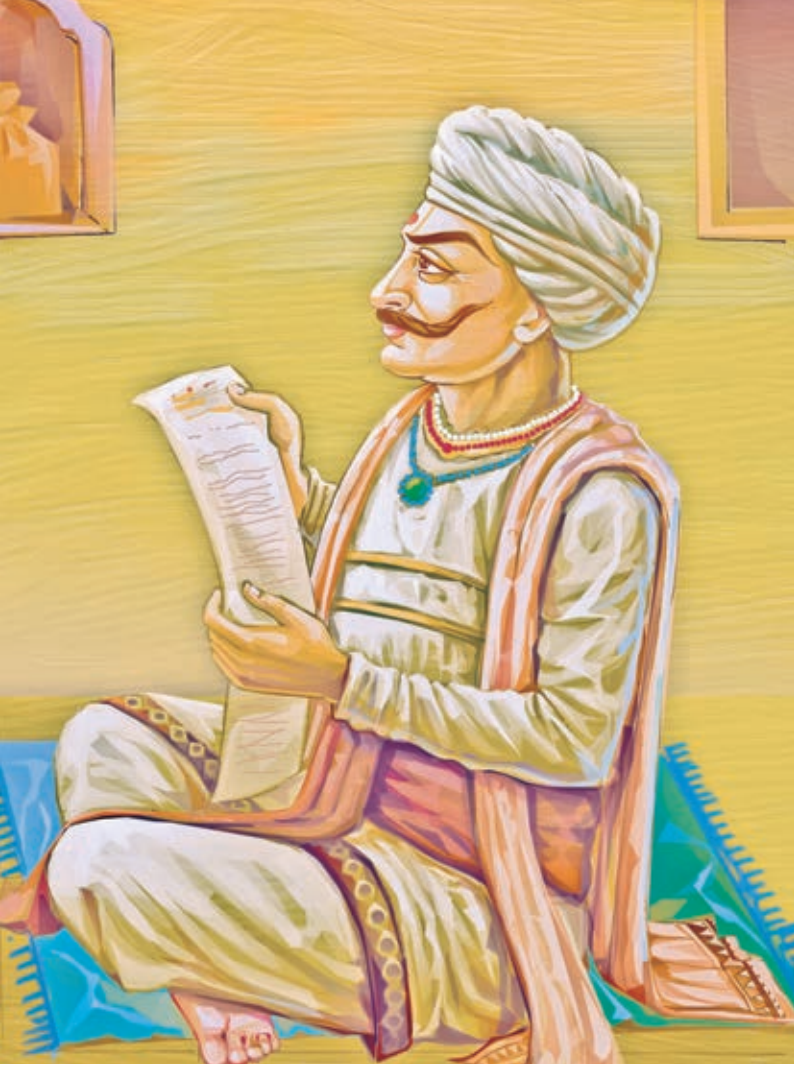
ભક્તરાજ દરબાર શ્રી ઝીણાભાઈ